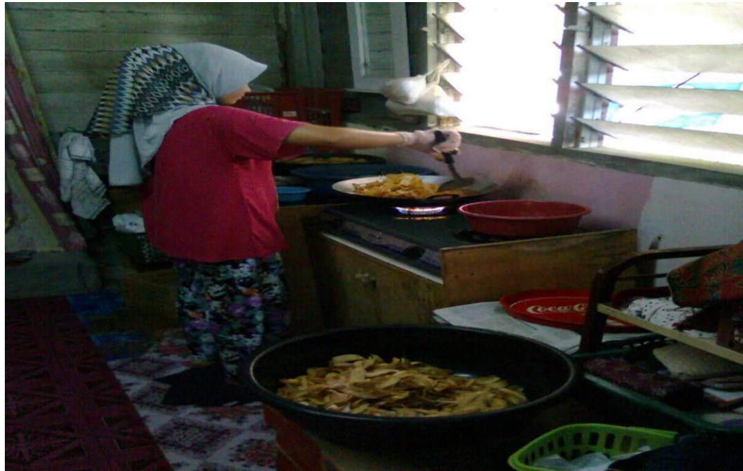
Caption : Proses Menghasilkan Produk