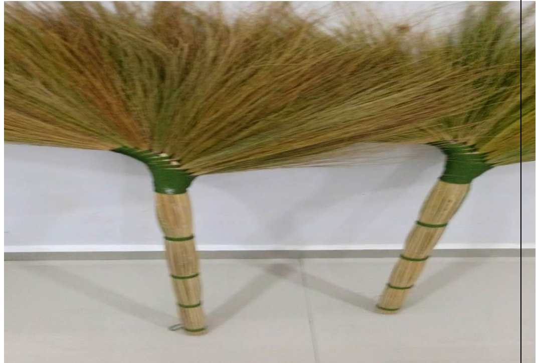
Caption : Penyapu Rami