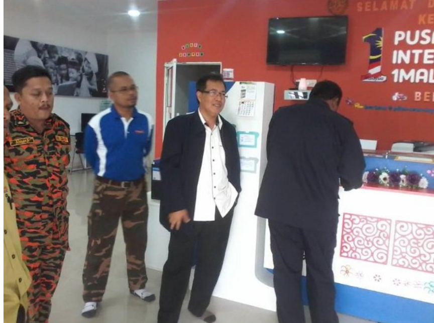
Sesi Menandatangani Buku Lawatan Daripada Pelawat