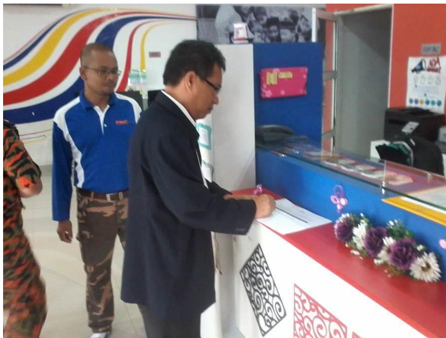
Tandatangan Buku Rekod Pelawat Daripada Ketua Jajahan Gua Musang