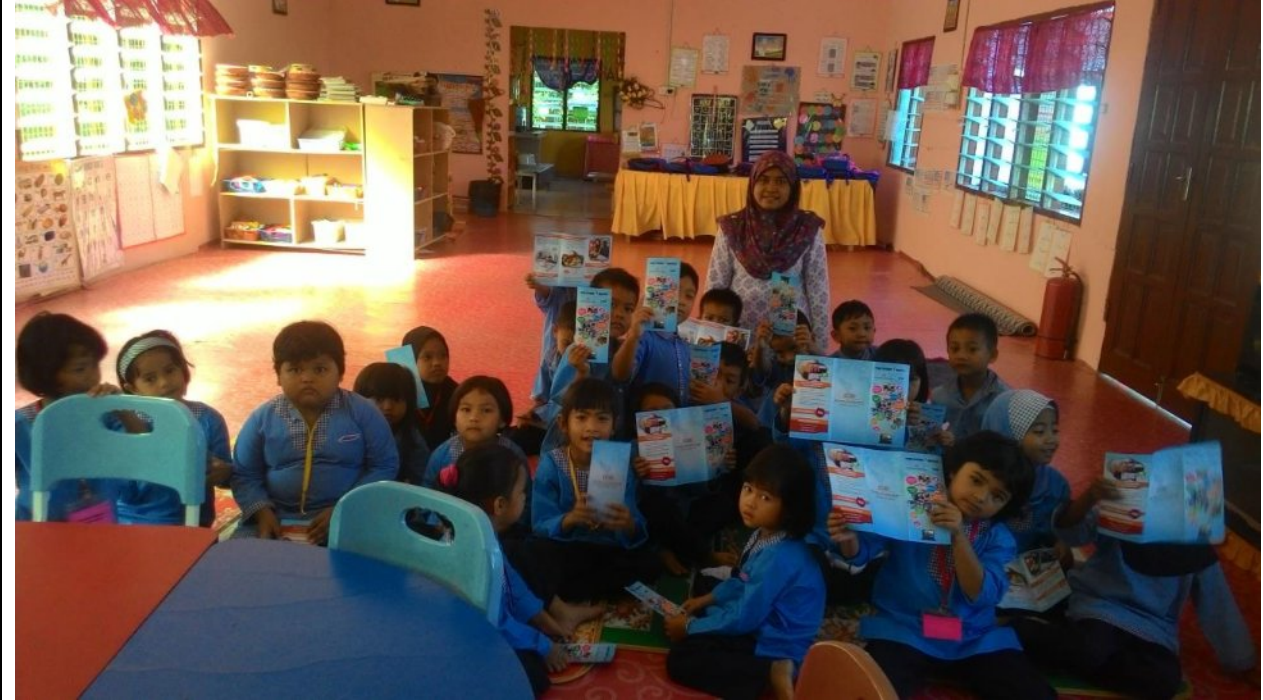
KDB Bersama Para Pelajar Tadika Sri Seroja