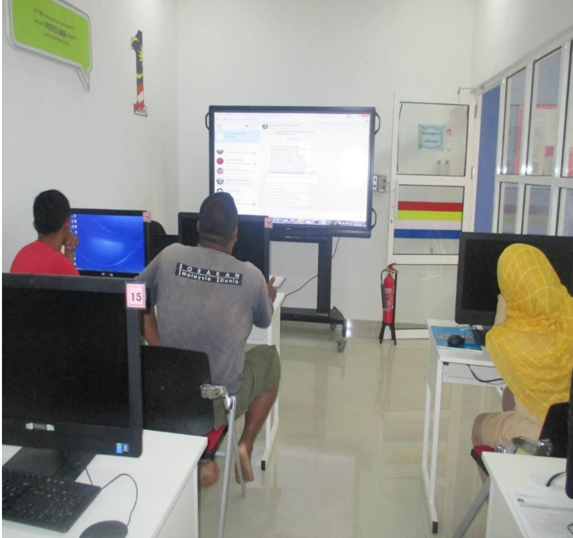
Kelas Keusahawanan Bersama Belia