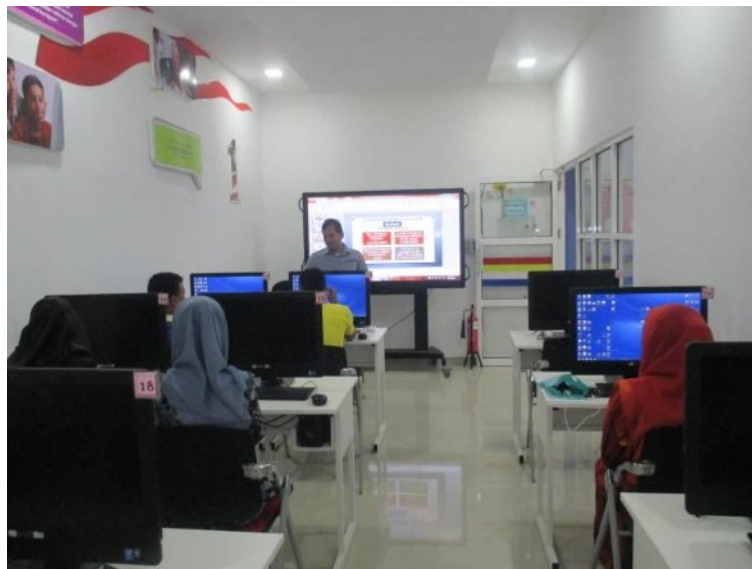
Kelas Pengenalan PI1M daripada Pengurus Pi1m Bertam