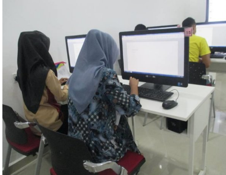
Pengenalan Kepada Microsoft Word Pengurus Pi1m Bertam