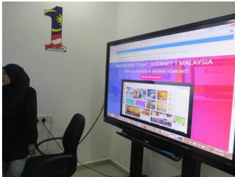
Pengenalan Dashboard Dalam Komuniti daripada Penolong Pengurus Pi1m Bertam