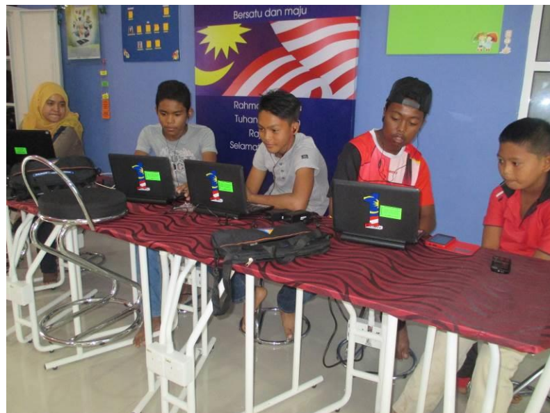
Sesi Peminjaman Notebook 1 Malaysia Dan Penerangan Ringkas