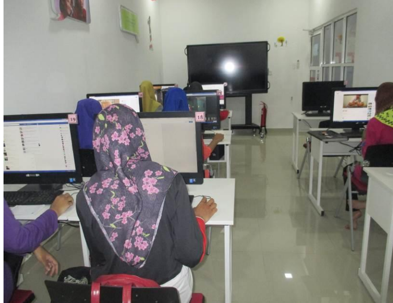
Carian Dalam Internet Untuk Kerja Kursus Tingkatan 5