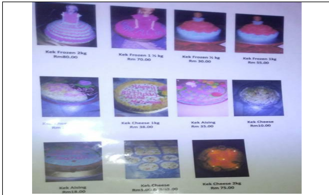
Caption : Antara koleksi kek yang dihasilkan yang ditempah oleh pelanggan beliau