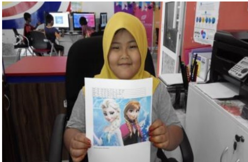
Caption: Mencipta Jadual Kelas