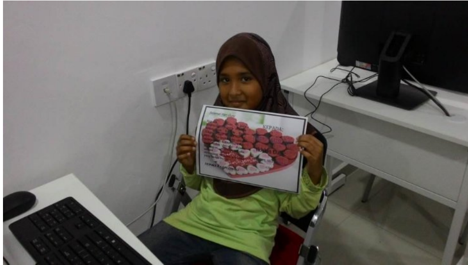
Caption: Menghasilkan Kad Ucapan Hari Guru