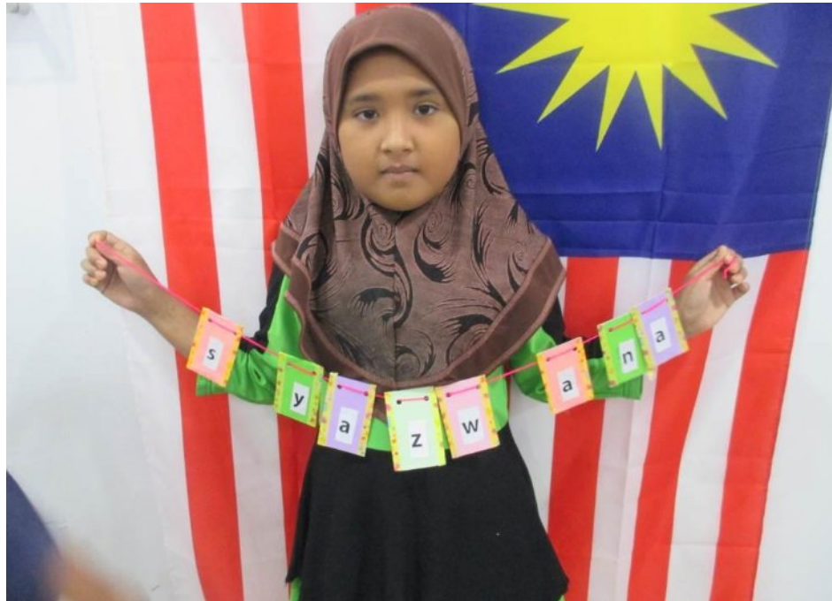
Caption : Kelas Kreativiti menghasilkan hiasan menggunakan kad lama (recycle)