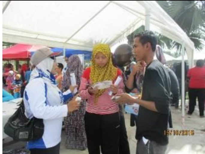
Penerangan E-Waste kepada pengunjung oleh Pengurus Pi1M Felda Chiku 3