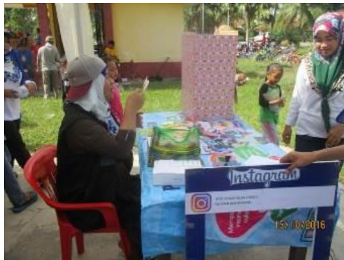
Meja pendaftaran kesihatan percuma oleh PI1M Kluster Gua Musang