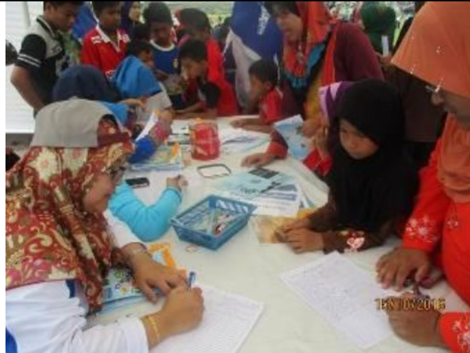
Sesi Pendaftaran pengunjung ke booth PI1M