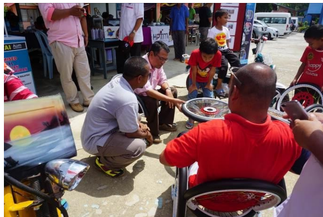
Salah satu pameran kitar semula barangan terpakai