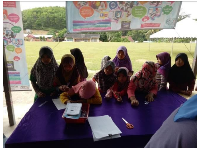
Pendaftaran untuk menyertai Kuiz oleh Pelajar Sek. Rendah